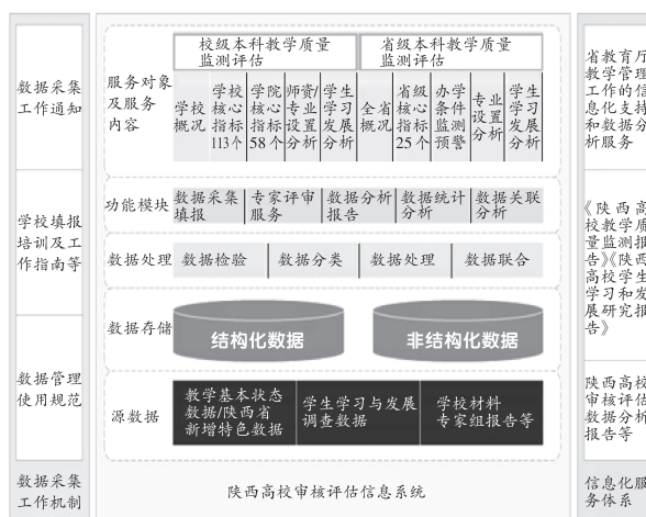
图2 省校二级本科教学质量常态化监测评估体系

养方案等非结构化数据。利用大数据挖掘、分析技术,对教学过程中输入—过程—产出三环节各要素按不同类型、层次、性质高校计算常模,并对三环节要素之间的关系进行关联分析、深度挖掘,构建本科教学质量监测评估核心指标,形成全省和参评学校二级本科教学质量常态化监测评估机制。